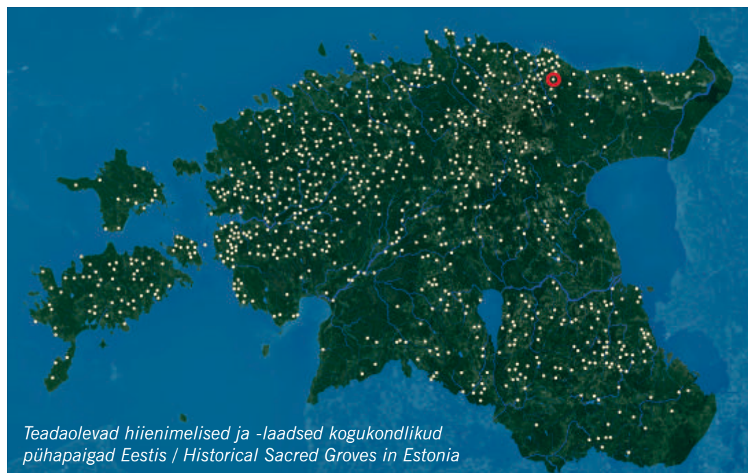
Teadaolevad hiienimelised ja -laadsed kogukondlikud pühapaigad Eestis / Historical Sacred Groves in Estonia

Tammealusel on tavaks väravast sisenedes ja väljudes lokulauale koputada. Enne hiide sisenemist seisata ja selita meeli.