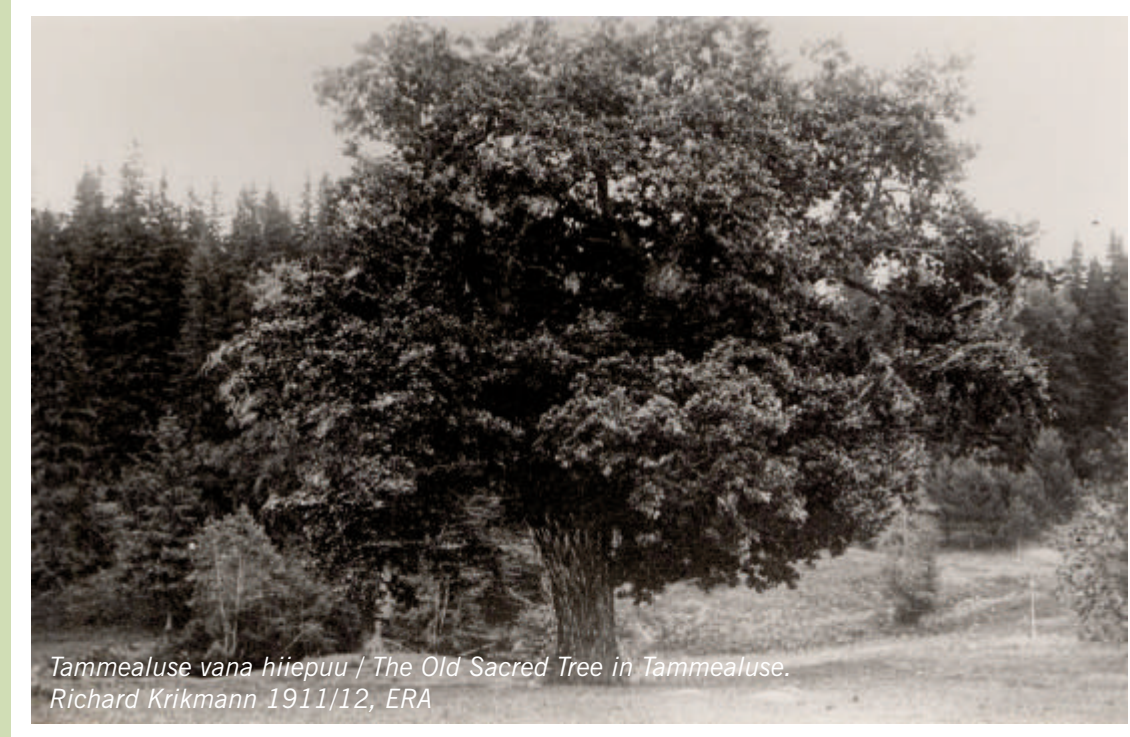
Tammealuse vana hiiepuu / The Old Sacred Tree in Tammealuse. Richard Krikmann 1911/12, ERA

Whereas the original sacred tree no longer exists, a new oak tree has reached stately age at its site, calling people under its branches to keep up ancient traditions. The main custodian of Tammealuse grove is Viru