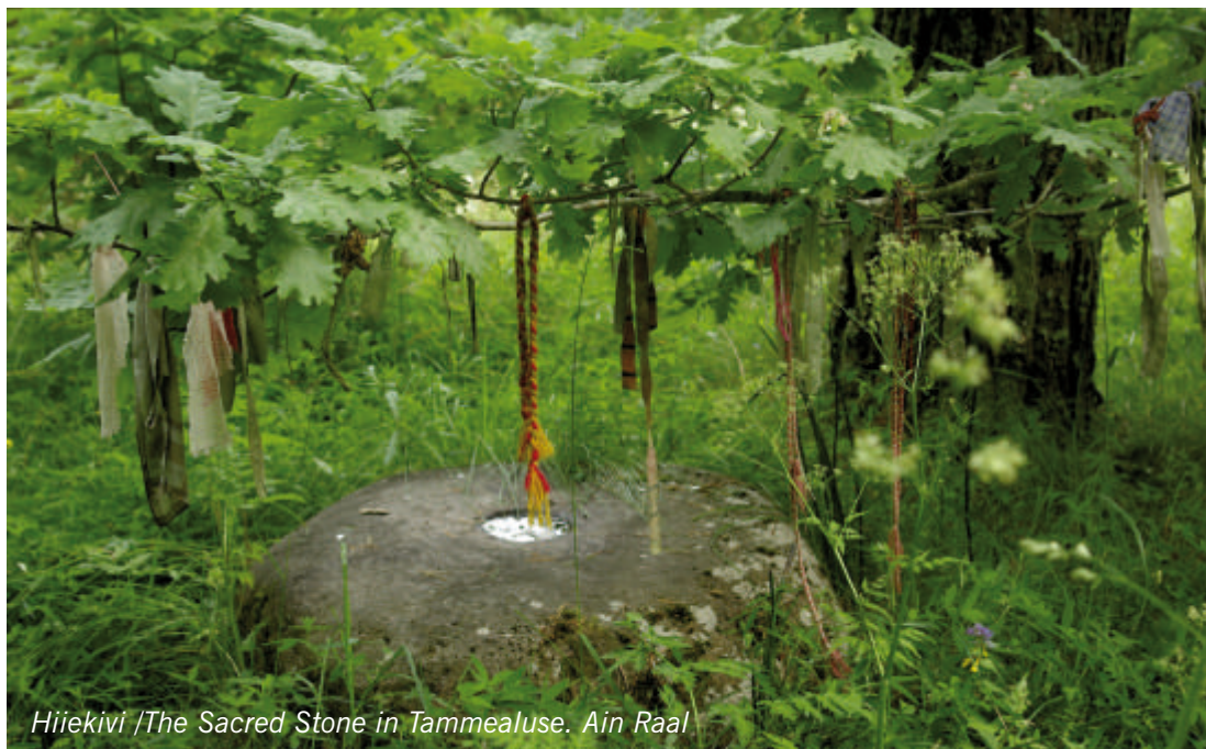
Hiiekivi /The Sacred Stone in Tammealuse. Ain Raal

Sa seisad Tammealuse hiie väravas. See on ajalooline looduslik pühapaik, kuhu on tulnud ja tullakse osa saama looduse väest ja rahust ning esivanemate lähedusest.